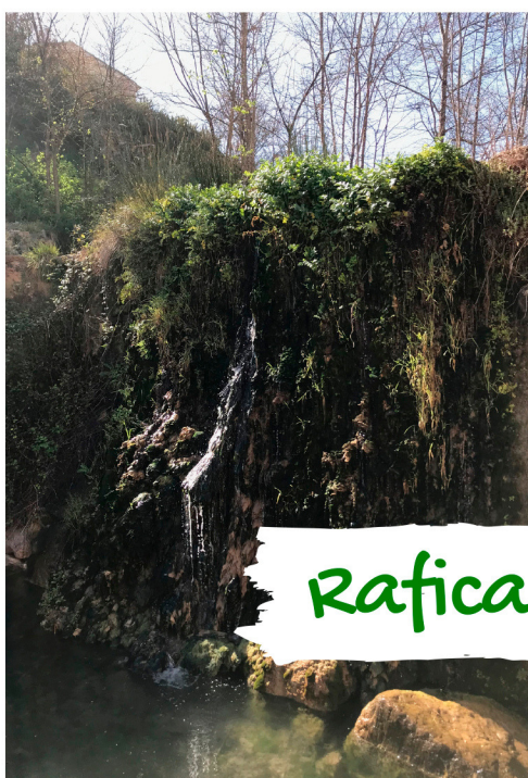
Rafica y quinconces